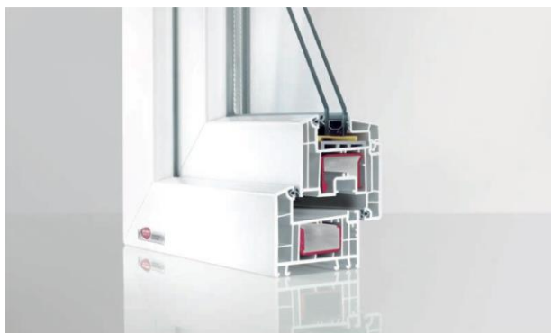
Den styva stålkärnan ligger i en sluten kammare i profilen vilket gör att stålet inte leder kyla från en kammare till en annan.

Då du investerar tid och pengar i ditt eget hem vill du också att det ska motsvara dina förväntningar in i minsta detalj. Om vacker design, bekvämlighet och låga uppvärmningskostnader är viktiga parametrar för dig i ditt fönsterval så har du fattat ett riktigt beslut om du valt EURO 70. Prisvärt fönstersystem som motsvarar dagens högt ställda krav för byggstandard. Med ett stort antal olika former, kulörer och spröjsar ger EURO 70 dig nästintill obegränsade möjligheter. Många olika önskemål kan förverkligas med detta system.